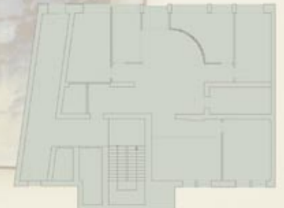
Grundriss Erdgeschoss ca. 173 m 2