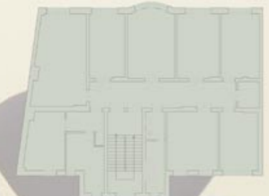
Grundriss 1. Obergeschoss ca. 221 m 2