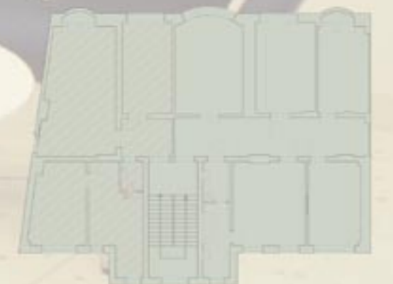
Grundriss 2. Obergeschoss ca. 88 m 2

Pirna ist das „Tor zur Sächsischen Schweiz“, der herrlichen Berglandschaft rund um das südliche Elbtal. Die Große Kreisstadt bildet zugleich einen wichtigen Baustein der Wirtschaftsregion Oberelbe, des bedeutendsten Wirtschaftsraums mit Flair in den neuen Ländern. Die rund 40.000 Einwohner zählende Kreisstadt grenzt unmittelbar an die sächsische Landeshauptstadt Dresden und liegt im Zentrum einer Region, in der rund 1,2 Millionen Menschen leben, wohnen und arbeiten. Hier sind international bedeutende Branchen beheimatet, wie Mikroelektronik, Elektrotechnik/Feinmechanik, Biotechnologie und ein ex-